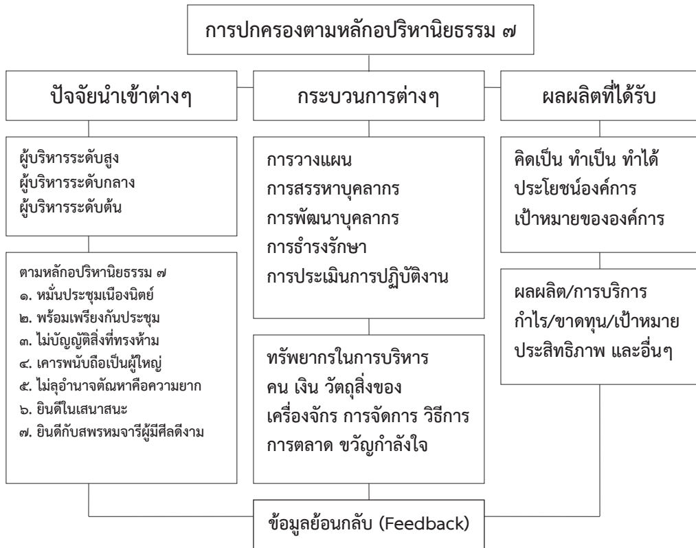
แผนภาพ การปกครองตามหลักอปริหานิยธรรม ๗

ให้แก่พระภิกษุสงฆ์ เป็นการปรารถนาเหตุของการแตกความสามัคคี ซึ่งมีผลให้กษัตริย์แห่งแคว้นวัชชีต้องแตกทำลายเสียอาณาเขตให้กับพระเจ้าอชาตศัตรู กษัตริย์ผู้ยิ่งใหญ่แห่งกรุงราชคฤห์ เหตุแห่งการแตกความสามัคคีในครั้งนั้น น่าจะเป็นข้อคิดเหตุสะกิดใจได้เป็นอย่างดี ในยุคสมัยนี้ หากจะวิเคราะห์ห่อปรีหานิยธรรม ๗ ซึ่งกษัตริย์แห่งแคว้นวัชชี ซึ่งรวมกันเรียกว่า กษัตริย์ลิขณวีใช้ในการบริหารองค์กรแล้วจะเห็นได้ว่า ข้อปฏิบัติซึ่งจะเสริมสร้างความสามัคคีกลมเกลียวกันอย่างมั่นคงในองค์กรใดๆ ก็ตาม ที่ประพฤติได้อย่างสม่ำเสมอและมั่นคง เมื่อพิจารณาแต่ละข้อจะมีรายละเอียดดังต่อไปนี้ ๕